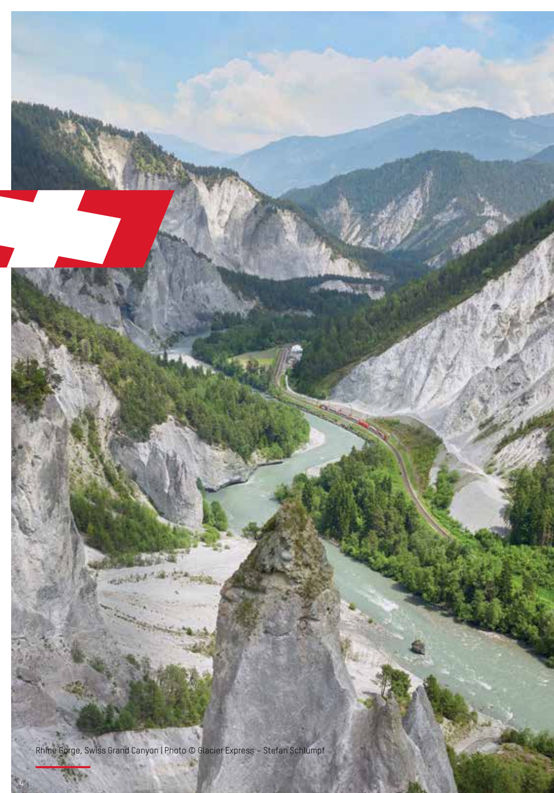
Rhine Gorge, Swiss Grand Canyon | Photo © Glacier Express - Stefan Schlumpf